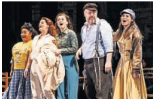
▲ Fiddler on the Roof is nog t/m 4 februari in het Chassé Theater te zien.

Wat: Fiddler on the Roof Waar: Chassé Theater, Breda Wanneer: dinsdag 16 januari 2018